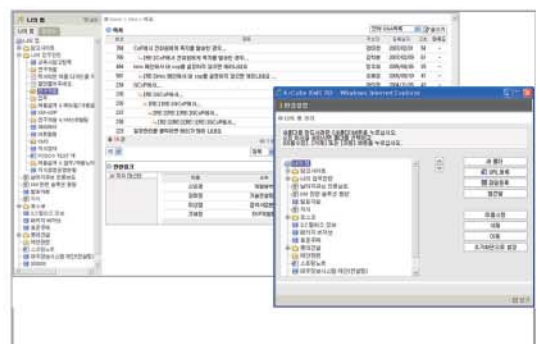
KM의 개인화 화면