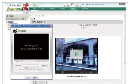
UCC Knowledge 등록 및 조회 화면