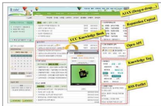
Web2.0 기술이 적용된 사용자 메인화면